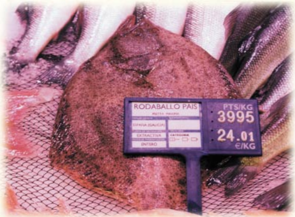
Rodaballo procedente de pesca extractiva.