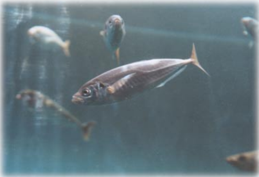
Xurelos nadando nun acuario.